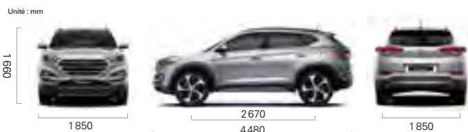
Version 1.6 4x2 BVM